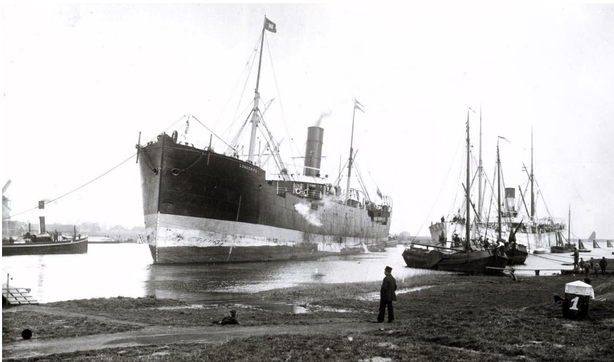
Stoom- en zeilschepen in de oude zeehaven van Zaandam begin jaren '90 van de 19 de eeuw. Links het Eiland met uiterst links een fragment van molen de Roode Leeuw die in 1916 gesloopt werd. Vooraan is een stukje te zien van het zgn. Zwarte Paadje waar langs vooral op zondagen veel mensen naar de zeeschepen kwamen kijken.

In de 19 de eeuw kende industrieel Zaandam een flinke malaise. De Voorzaan en het IJ waren vanwege het dichtslibben steeds slechter bevaarbaar voor grote schepen en daarnaast verliep de omschakeling van wind- naar stoomenergie erg traag. De inpoldering van grote delen van het IJ en het graven van het Noordzeekanaal vanaf 1876 zouden het isolement waarin de Zaanstreek verzeild dreigde te raken, doorbreken. In 1879 werd het Zijkanaal G aangelegd en het buitendijkse schiereiland (Ooster- en Westerkattegat) doorgraven waardoor een rechte doorvaart tot stand kwam en in de Voorzaan het Eiland ontstond. De natuurlijke loop van de Voorzaan ten westen van het Eiland werd uitgebaggerd tot een diepte van 9,5 meter en kreeg de functie van zeehaven en vrij snel kwamen de zeil- en stoomschepen vrachten, voornamelijk hout en rijst, afleveren in Zaandam. Naast de vele nog bestaande houthandels en -zagerijen ontstonden ook nieuwe bedrijven zoals William Pont en Bruynzeel en vooral deze laatste twee zouden zich