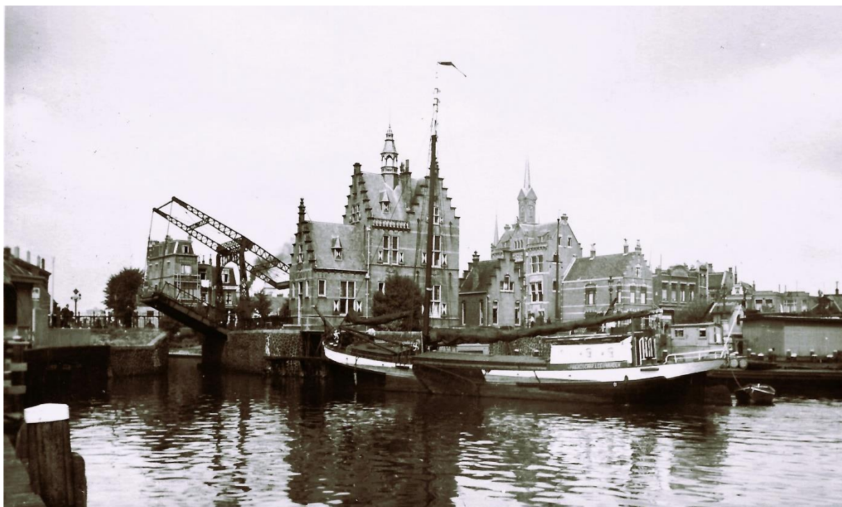
Een klipper vaart de toegang naar de Grootte of Hondsbosche sluis en moet eerst de 'kleine' Wilhelminabrug passeren. Is het schip de brug eenmaal gepasseerd zal de mast gestereken moeten worden om verder te varen want over de Grootte Sluis ligt een vaste brug.