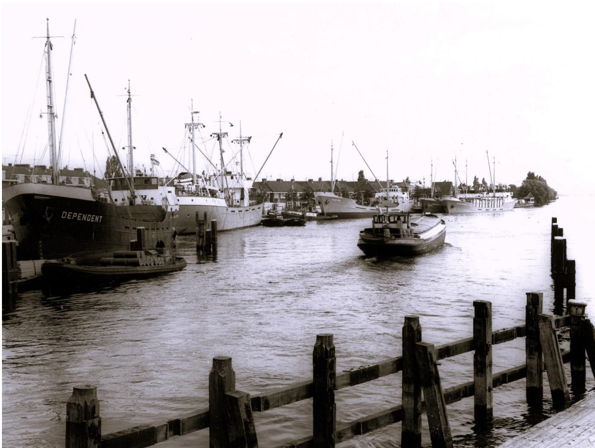
Foto vanaf de Wilhelminabrug van de drukte met schepen langs Burcht en Prins Hendrikkade halverwege de jaren '60.

ontwikkelen tot resp. de grootste houtimporteur van Europa en het grootste houtverwerkende bedrijf van Nederland. Maar zij waren niet de enigen. In het Westzijderveld waren ruim tien kleine en middelgrote houthandels en -zagerijen gevestigd en in overige delen van Zaandam ook nog eens een aantal. Een groot deel van die bedrijven was al ontstaan in de 18 de eeuw en sommige werkten nog tot kort ná 1900 met windmolens. De activiteit in de haven nam ondertussen zulke proporties aan dat in 1909 besloten werd om een nieuwe zeehaven aan te leggen ten westen van de spoorlijn. Deze tweede haven werd in 1911 geopend door prins Hendrik en een deel hiervan werd gebruikt als balkenberging. Tot aan de Eerste Wereldoorlog kwamen jaarlijks ruim 200 zeeschepen naar Zaandam en leverden hier 50% van de totale Nederlandse houtconsumptie af. Na de Eerste Wereldoorlog daalde de aanvoer van ongezaagd rondhout met sprongen, omdat de productielanden zelf gingen zagen. De aanvoer van gezaagd hout bleef echter gehandhaafd en groeide ná de Tweede Wereldoorlog zelfs enorm. Opnieuw ontstond ruimtegebrek in de havens en werden in de jaren '60 in de Achtersluispolder twee nieuwe insteekhavens aangelegd. Desalniettemin kwam het geregeld voor dat schepen langs de Burcht en Prins Hendrikkade hun lading moesten lossen omdat in de havens geen plek was. Het aantal bezoekende schepen groeide in die periode