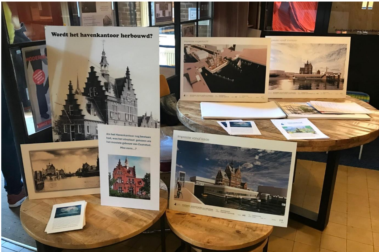
De Havenkantoor informatietafel in de Fluxus Verkadefabriek.

Op zaterdag 5 oktober vond het Babel Festival 100 jaar Zaanstad plaats ter gelegenheid van het feit dat de samenvoeging van zeven voormalige Zaaingemeentes tot de gemeente Zaanstad in 1974 plaatsvond. Het Zaanse Architectuurplatform Babel greep die gelegenheid aan om niet alleen terug te kijken op de afgelopen 50 jaar maar vooral om vooruit te kijken naar de komende 50 jaar. Hoe wordt de gemeente ervaren en wat zou kunnen of moeten gebeuren om de stad nog beter, fijner en mooier te maken. Dit werd vormgegeven met workshops, exposities, lezingen, demonstraties en muziek. Omdat de Stichting Havenkantoor Zaandam een waardevolle bijdrage hoopt te gaan leveren aan het stadsbeeld op het sluisencomplex waren wij ook aanwezig met een informatietafel. Het was de hele middag gezellig druk en we hebben met veel bezoekers gepraat over het project en ook weer enkele tientallen namen kunnen toevoegen aan het lezersbestand van de Havenkantoor Nieuwsbrief. Het kan niet anders gezegd worden dat de teneur zeer positief was. Er werd geïnteresseerd en enthousiast gereageerd door de bezoekers.